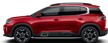
Красный металл ROUGE ELIXIR