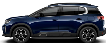
Синий металл ECLIPSE BLUE