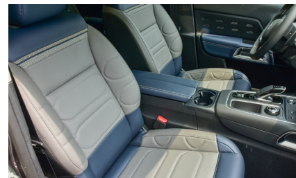
Комбинированная отделка сидений из кожи синего и серого цвета и материала Alcantara