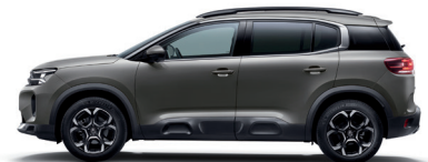
Серый металл GRIS PLATINUM