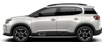
Белый перламутр BLANC NACRE