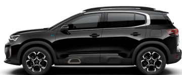
Черный металл NOIR PERLA NERA